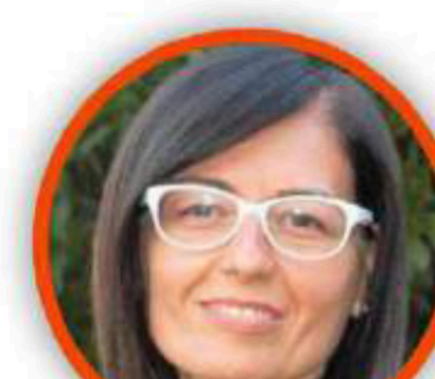
MARIE ANNA FEBBRAIO SECONDARIA DI PRIMO GRADO